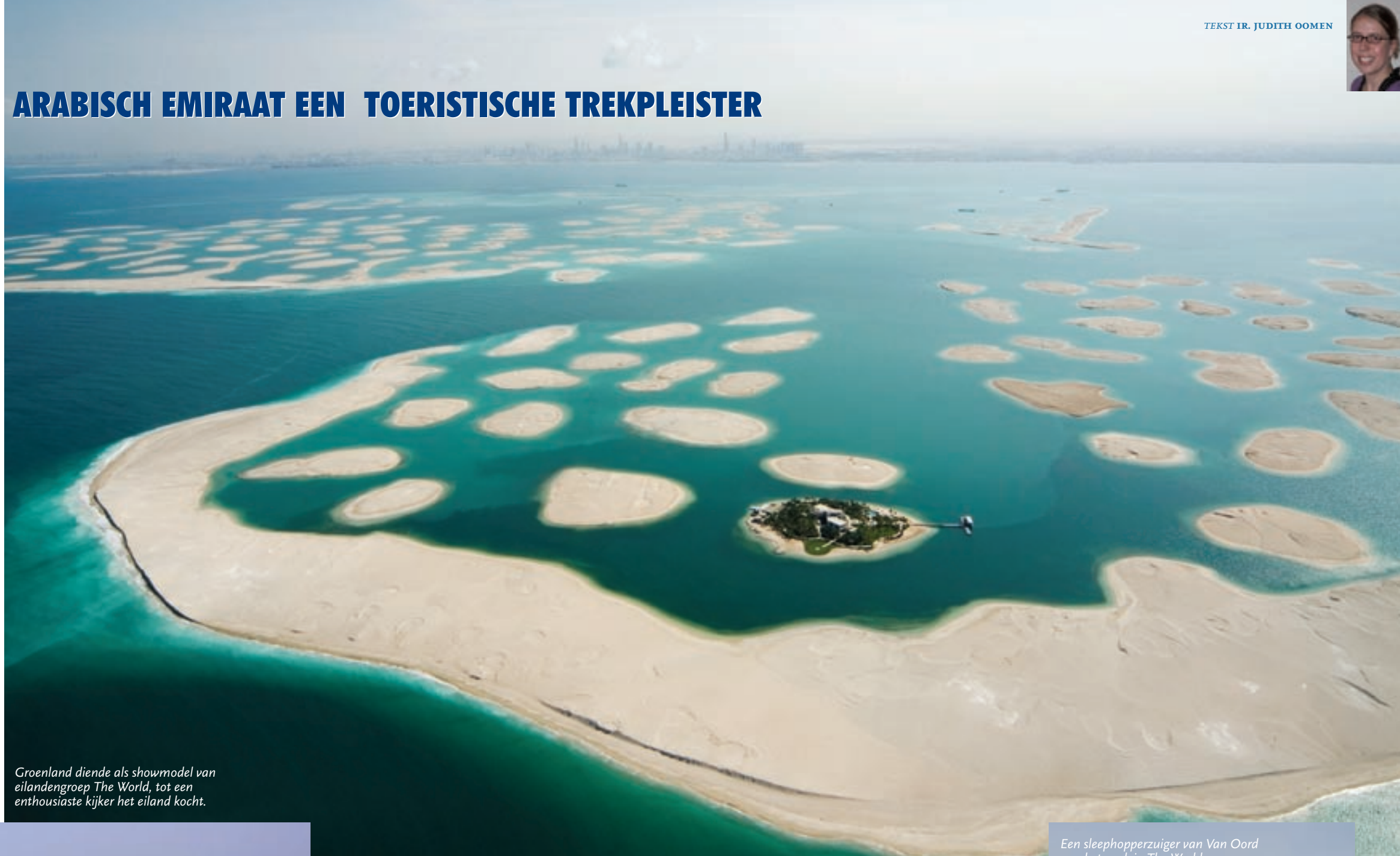
Groenland diende als showmodel van eilandengroep The World, tot een enthousiaste kijker het eiland kocht.

dat leefde van de handel. De ontdekking van olie in 1966 bracht de ommekeer. Inmiddels telt het stadstaatje in de Verenigde Arabische Emiraten 1,6 miljoen inwoners, en dat moeten er in 2030 maar liefst tien miljoen zijn. De bouwwoede in het sjeikdom is dan ook ongekend: op dit moment zijn er vijfhonderd wolkenkrabbers in aanbouw en bestaan er plannen voor nog eens tweeduizend torens. Voor de kust liggen reeds twee eilanden in de vorm van een palmboom, worden een derde palm en een scorpioenstaart opgespoten, en nadert The World, een eilandengroep die de wereldkaart symboliseert, voltooiing.