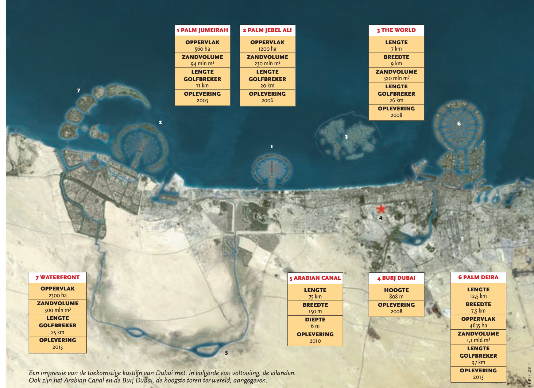
Een impressie van de toekomstige kustlijn van Dubai met, in volgorde van voltooiing, de eilanden. Ook zijn het Arabian Canal en de Burj Dubai, de hoogste toren ter wereld, aangegeven.

personenwagens als benzine zijn goedkoop, waardoor bijna iedereen een auto heeft. In Dubai is ook nauwelijks openbaar vervoer: mensen zonder eigen auto verplaatsen zich per taxi. Sjeik Mohammed beseft dat mensen de auto uit moeten en richtte daarom twee jaar geleden de Roads and Transport Authority (RTA) op. De RTA heeft snel gehandeld en legt in recordtempo een metronetwerk aan: vorig jaar is de constructie van de vier lijnen gestart, in 2009 moeten ze in gebruik zijn. De bouw lijkt op schema te liggen. Door het hele emiraat loopt inmiddels een betonnen viaduct voor de metro, in verschillende fasen van gereedheid.