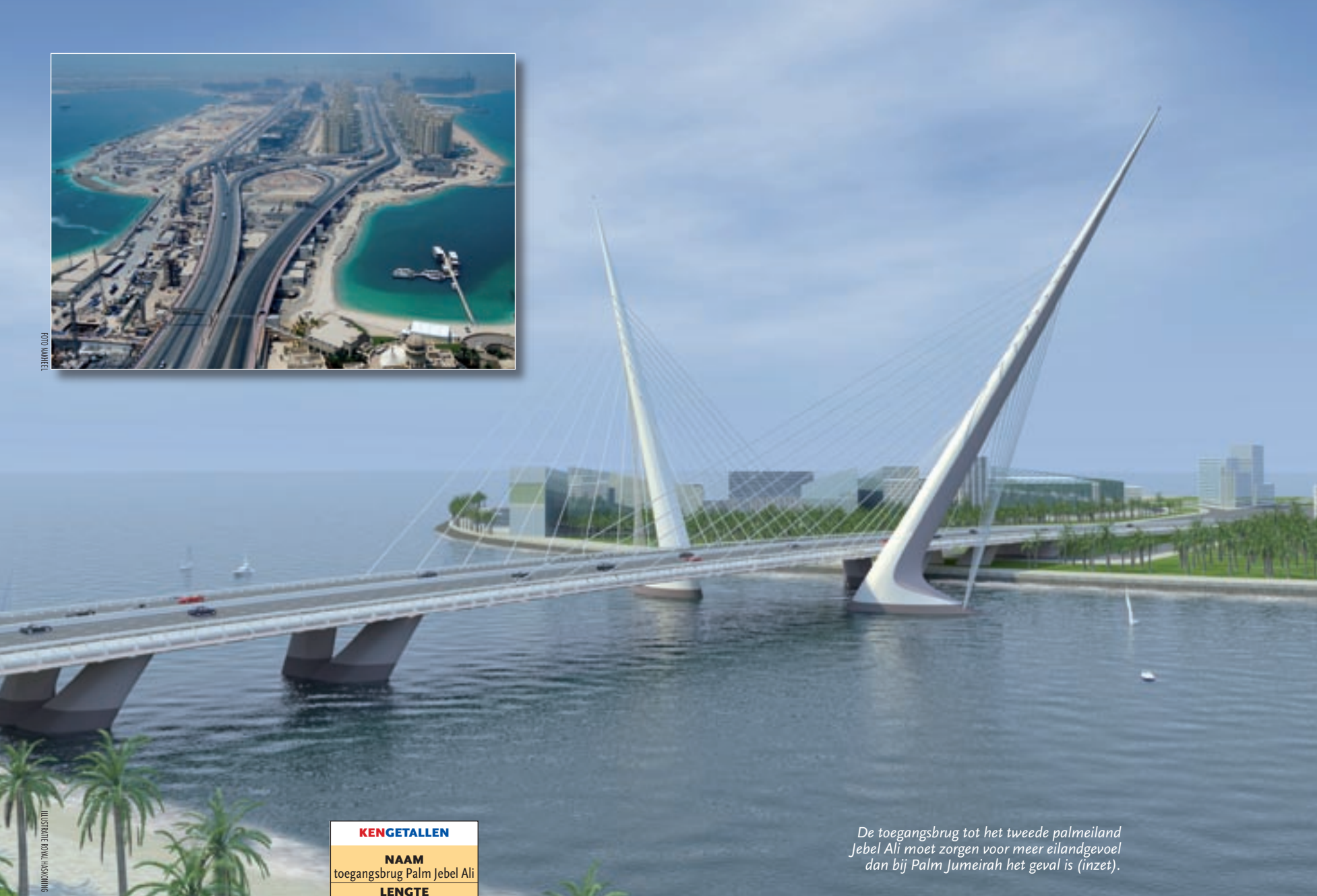
ILLUSTRATIE: ROYAL HASKONING