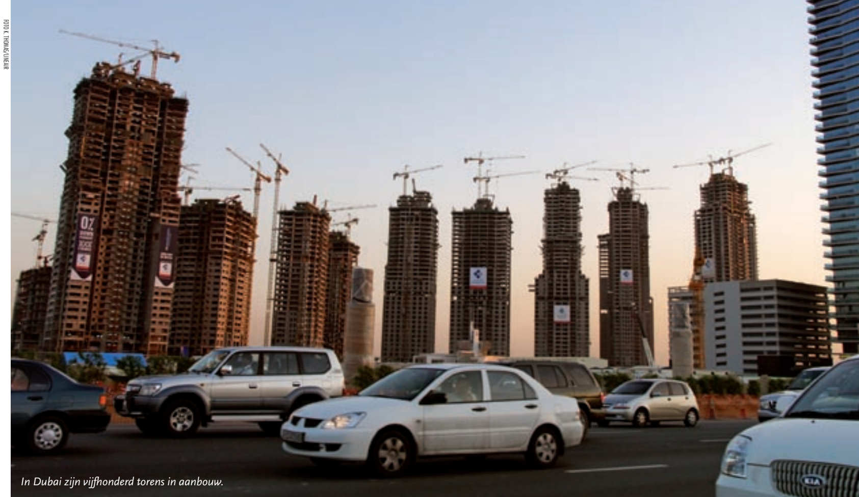
In Dubai zijn vijfhonderd torens in aanbouw.