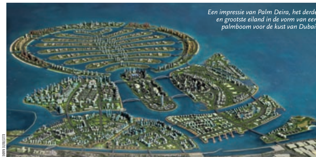
Een impressie van Palm Deira, het derde en grootste eiland in de vorm van een palmboom voor de kust van Dubai.